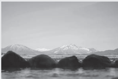
ぼんぼこの湯からの景色 (イメージ図)