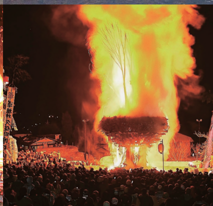
野沢温泉村 道祖神祭り