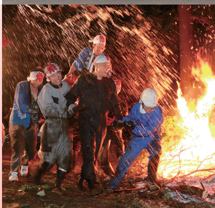
木島平村 柱松子 (内山地区)