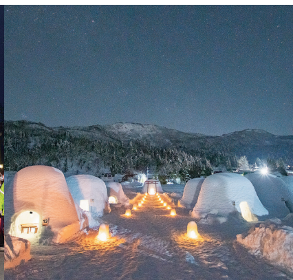
飯山市 かまくらの里