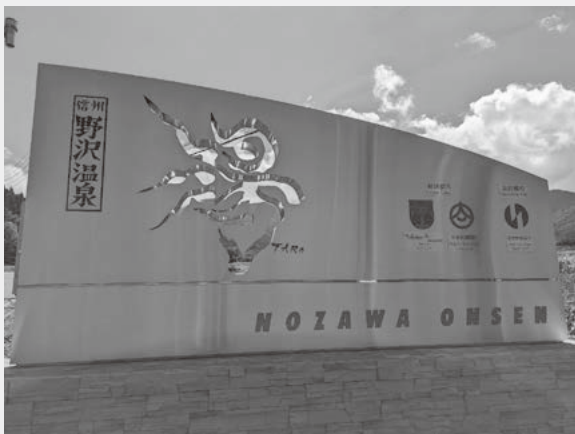
姉妹都市提携モニュメント