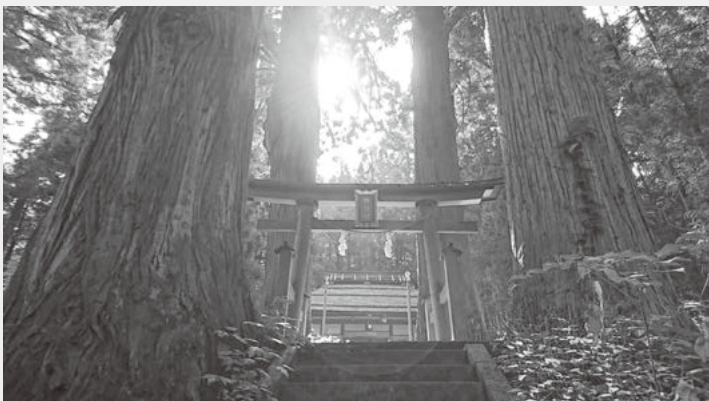
乗廻の四本杉