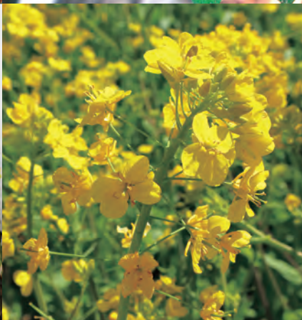
野沢温泉村 野沢菜の花