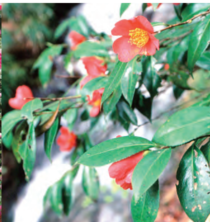
飯山市 ユキツバキ