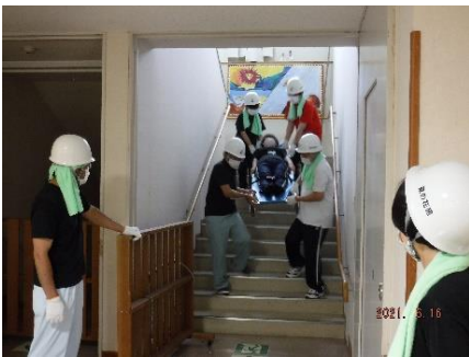
担架に乗せて2階へ搬送