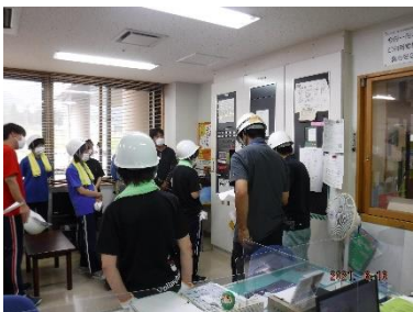
消防署への通報訓練

火災に対応した通報、消火訓練と、土砂災害避難指示発令を想定し、職員による避難誘導訓練が行われました。菜の花苑は土砂災害警戒区域内にあり、施設の二階に避難させる階段搬送訓練を実施しました。