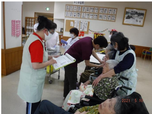
スムーズに接種が行われました