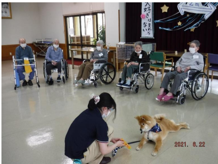
三匹の犬が来てくれました