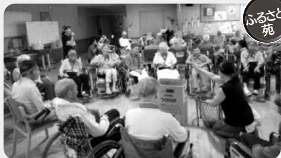
ふるさと苑 ふるさと苑では、今年も恒例の運動会を開催しました。赤・白に分かれて玉入れ、大玉送りなど参加者全員で体を動かし楽しく行いました。得点はシーソーゲームで一つ一つの競技に力が入る展開でした。