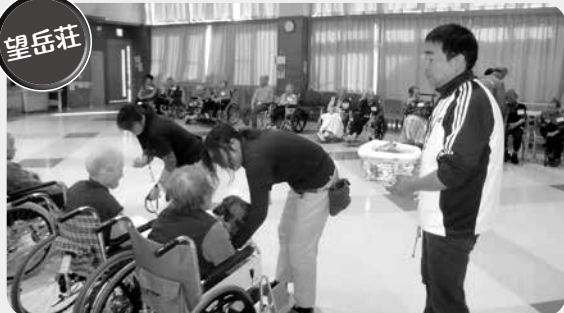
望岳荘 望岳荘では、10月18日に長野県動物愛護センターのご協力のもと、犬4匹、ウサギ1羽とふれあい交流を行いました。犬やウサギとのふれあいで、笑顔あふれる楽しい時間を過ごしました。

北信広域連合では、現在6か所の老人ホーム（特別養護老人ホーム、養護老人ホーム）を運営しています。利用者の皆さんが安心して楽しく生活できるよう、様々な行事を地域の皆様のご協力をいただきながら行っています。