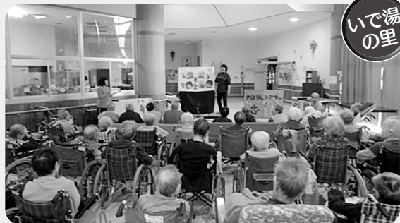
いで湯の里 いで湯の里では、毎月「喫茶の日」に「おはなしシアター」を行います。真剣に聞きながらも笑顔があふれています。