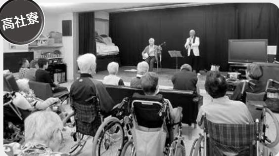
高社寮 高社寮では、10月5日にボランティアの皆様による、三味線と尺八の演奏が行われました。民謡や唱歌など迫力ある演奏が行われ、楽しい時間を過ごしました。