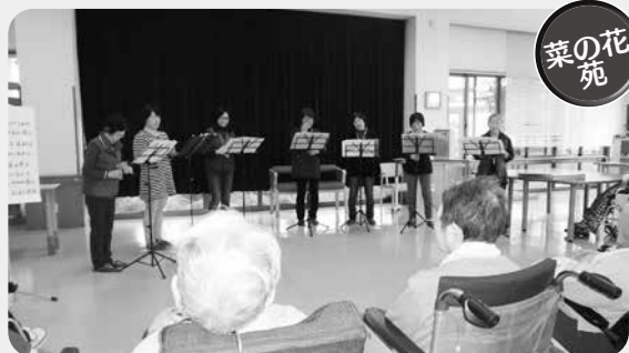
菜の花苑 菜の花苑では、11月10日にボランティアの皆さんによるコカリナの演奏会が開かれました。優しい音色の演奏に思わず口ずさんでしまう方もいたりして、とても穏やかな時間が過ごせました。