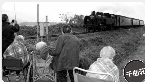
千曲荘 千曲荘では、11月14日に44年ぶりに飯山線を走るSLを、外出を兼ねて見学に行きました。試験運転ではありましたが、利用者の皆さん寒い中、昔を懐かしく思い出されていました。