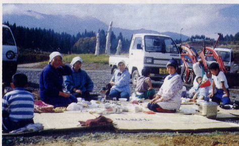
収穫の後は手作りの漬物やなめこ汁でおもてなし。見晴らしのよい畑を、現在は30aほど耕作している。

場所を選ばず強く咲き、だれにでも親しまれるタンポポ。「この花のように、時代に適応しながら活動が次世代へ受け継がれていけばと願っています」。