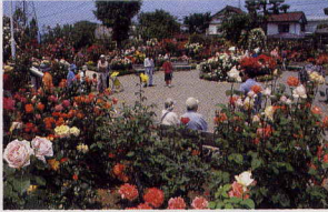
5月29・30日 一本木公園なかのバラまつり(中野市)