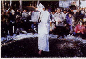
2月4日 上林不動尊 千駄焚き(山ノ内町)