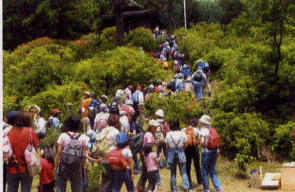
6月上旬 つつじまつり(野沢温泉村)