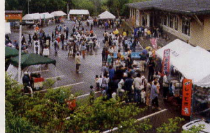
6月6日 豊田村ふるさと祭り(豊田村)