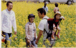
5月 いいやま菜の花まつり(飯山市)