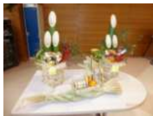
大きなしめ縄や門松などの正月飾りをいただきました。