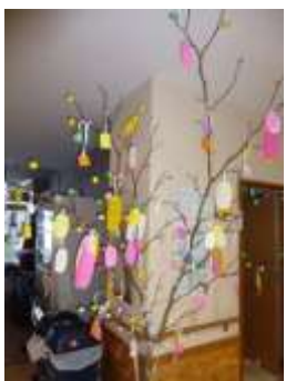
「何ができるかな？」楽しくものづくりができました。