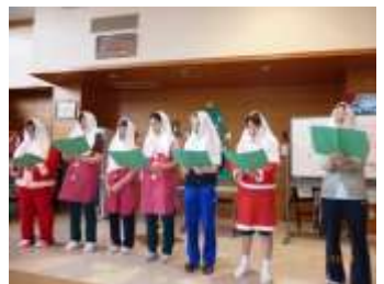
写真上：12月生まれの皆さん。