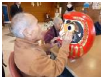
思い思いの願い事しながら、だるまの目入れを行っていただきました。

両眼が開眼しただるまは、一年間見守っていたことに感謝しながら、地元稲荷区で十二日に行われるどんど焼きで焚いていただきます。